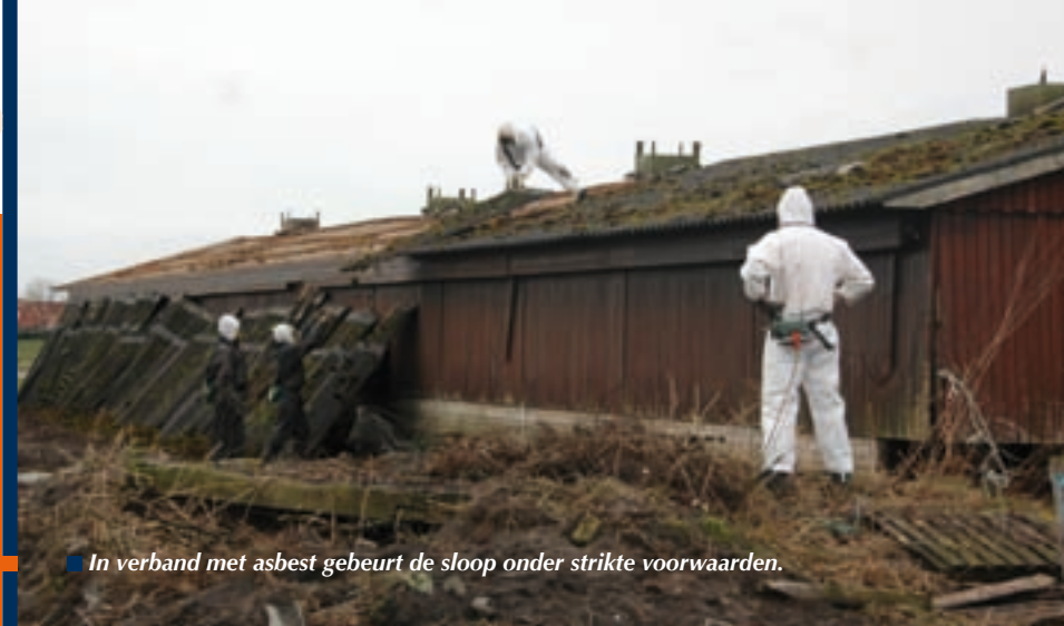
In verband met asbest gebeurt de sloop onder strikte voorwaarden.