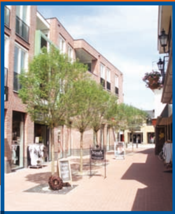
■ Fraaie inrichting van het centrum en alle winkelruimte verhuurd.