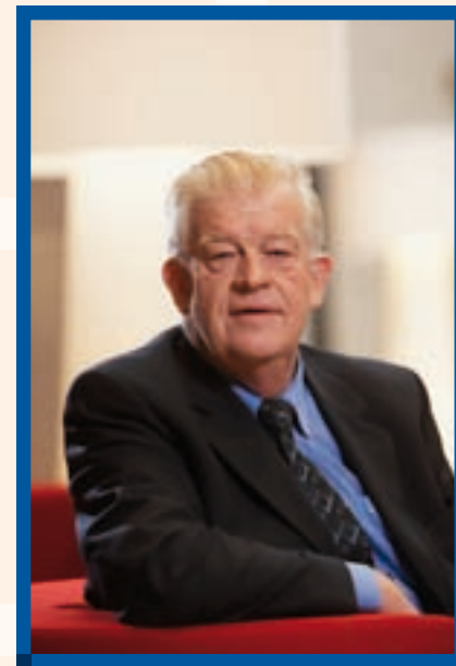
■ Wethouder Auke Koops van 't Jagt.